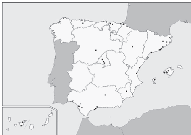
Figura 2. Distribución territorial de incidentes químicos ocurridos en piscinas de España, 2008-2012